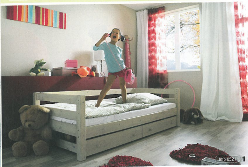
Info 0521 1