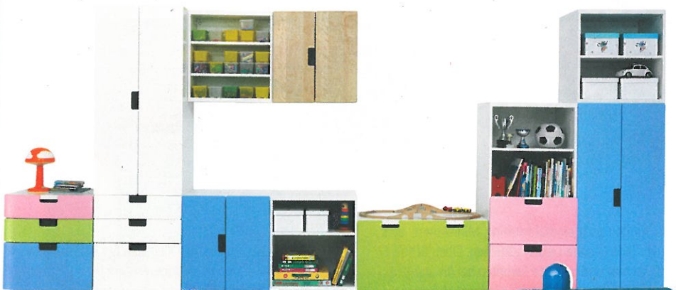
8 Info 0535

8 Baby- und Kinderzimmer kommen jetzt in Ordnung. Dank des neuen Aufbewahrungssystems „Stuva“ ist das Durcheinander überblickbar. Die Möbelemente lassen sich individuell zusammenstellen und wachsen mit den Kleinen mit. Von null bis zwölf Jahren bietet es für jedes Alter die passende Aufbewahrungslösung an. Preis: zum Beispiel 339 Euro (Maße: 279x50 cm, 128 cm hoch). Ikea | 9 Quak, quak tönt die Ente! So macht das Essen doppelt Spaß. Am Kinderlöffel sind lustige Holzspielzeuge befestigt – zum Beispiel Ente oder Polizeiauto. Preis: 13 Euro. donkey products