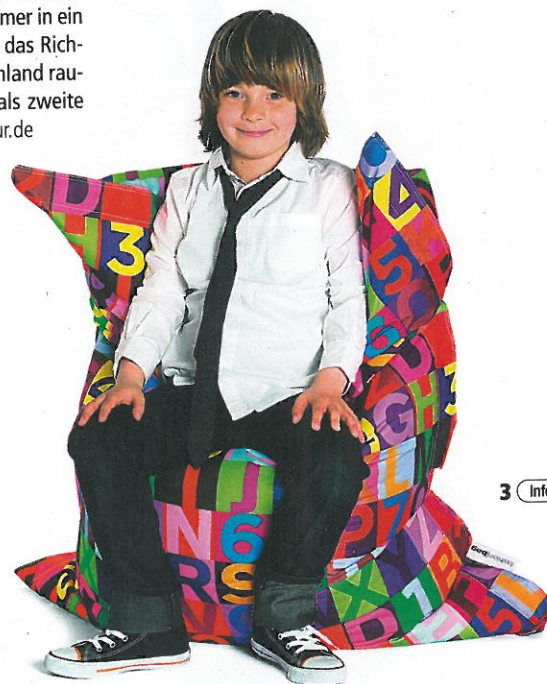
3 Info 0523

Um flexibel auf die unterschiedlichen Bedürfnisse der Kleinen einzugehen, sind wandlungsfähige Basismöbel gefragt wie nie. Die oftmals zeitlos gestalteten Konzeptlösungen können den Nachwuchs unter Umständen bis ins junge Erwachsenenleben begleiten. Dabei gilt: mit wenigen Handgriffen Möbel neu gestalten. So kann zum Beispiel das Babybett dank Zusatzteilen bequem zum Junior- oder Eta-