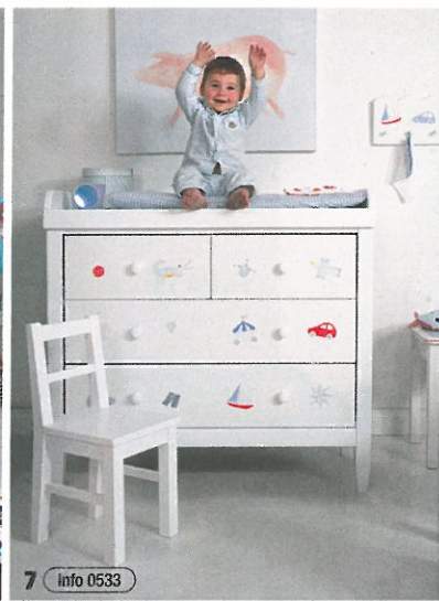
7 info 0533

3 Der Riesenspaß im Miniformat für Kids – zum Toben mit Freunden oder zum Reinkuscheln bei der Märchenstunde: „Mini Bull“ ist die Sitzsack-Kollektion für die Kleinen. Er ist mit EPS-Perlen gefüllt, der Bezug besteht aus Polyester. Preis: 129 Euro. Sitting Bull über www.design-3000.de | 4+5 Ein Schwarm bunter Vögel verleiht den Träumen Flügel! „FreeBird“ ist ein Minihochbett aus weißem Gestell und kleiner Himmelsleiter, überhängt mit einem transparenten Stoff auf dem zarte Vögelchen federleicht am Himmel kreisen. Der transparente Himmel-Stoff ist auch unabhängig als Stoffballen erhältlich, aus dem sich beispielsweise passende Gardinen anfertigen lassen. Preis: ab 1.025 Euro. Lifetime | 6 Warum nicht einen Schrank als Haus gestalten. Mit diesen Möbeln ist Ihrer Fantasie keine Grenzen gesetzt. Für das Innenleben können Sie Kleiderstange und oder Einlegeböden ganz nach Belieben bestellen. Geliefert werden die Schränke aus unbehandeltem oder weiß lasiertem Kiefernholz fertig montiert. Preis: ab 349 Euro. car-Selbstbaumöbel | 7 Individuell und zeitlos: Die hochwertigen Kindermöbel von isle of dogs begeistern kleine Jungen und Mädchen gleichermaßen. Die Möbelstücke werden im Atelier in Wuppertal auf Bestellung handbemalt – zum Beispiel auch die hier abgebildete Wickelkommode mit blauen und roten Motiven. isle of dogs