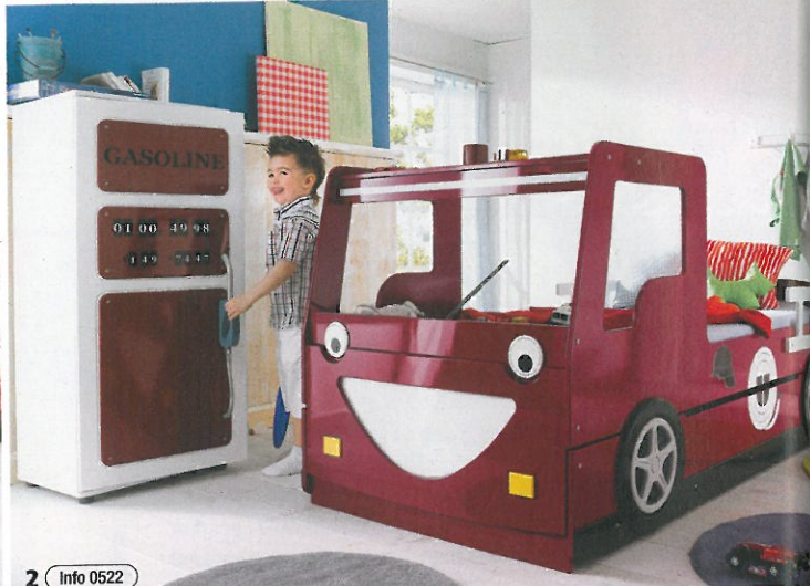
2 Info 0522

1 Um ein gesundes Raumklima im Kinderzimmer zu schaffen, sind Möbel aus natürlichen Materialien empfehlenswert. Eine große Auswahl an Massivholzmöbeln, die das Kinderzimmer in ein Spielparadies verwandeln, gibt es unter www.allnatura.de . allnatura.de/epr | 2 Genau das Richtige für unternehmungslustige Jungs: Ein Feuerwehrbett, mit dem sie schnell ins Traumland rauschen. Toll: Die Schublade kann als Stauraum oder auch – für den besten Freund – als zweite Schlafgelegenheit genutzt werden. Preise: Bett 349 Euro, Schrank 199 Euro. www.baur.de