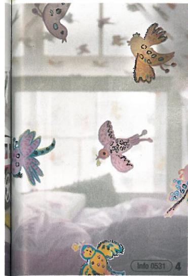
Info 0531 4