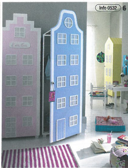
Info 0532 6